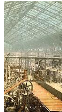
Industri i udvikling

Den nye malerkunst skabes og udvikles af kunstnere som Pablo Picasso og Georges Braque . De var på dette tidspunkt bosat i Paris, da denne by havde de fleste tilbud, hvis man skulle udvikle sig inden for kunstverden. Paris blev derfor det foretrukne sted for de fleste kunstnere i begyndelsen af det nye århundrede.