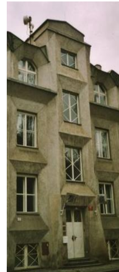
Hus i Prag