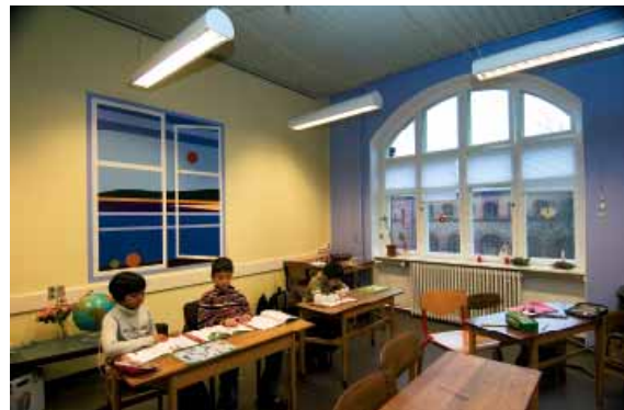
I 2005 forvandlede Københavns Malerlaugs malermestre et nedslidt klasselokale til et inspirerende lokale.